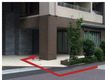
【ホームケア横浜 入口】